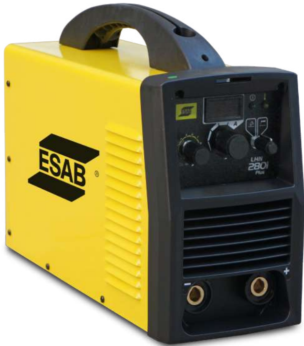
LHN 280i Plus

El inversor de soldadura LHN280i Plus es compacto e indicado para los servicios de herrería, reparación y mantenimiento leve.